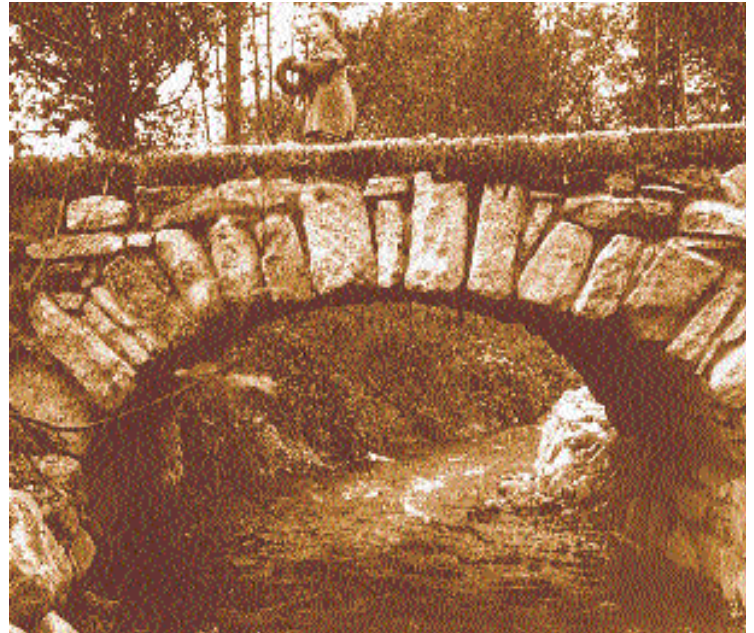
Spuren einer 100-jährigen Firmengeschichte: Bach-Bruggli im Himmelrych (1908), Bau de

Der Betriebsausflug für Belegschaft mit Partnerinnen und Partnern vom vergangenen Freitag, welcher in den bereits erwähnten Jubiläumsabend mündete, krönte eine eigentliche Veranstaltungsreihe zum 100. Geburtstag der Xaver Meyer AG. Mit Jassmeisterschaft, Osterüberraschung, Jubiläums-Sweatshirt und -Hemd, Grillkurs, Reusstalfahrt und Getränkeaktionen dankte das Unternehmen den Mitarbeiterinnen und Mitarbeitern für ihren Einsatz. Teilhaben am Jubiläumsjahr konnte mit der Einweihung von drei durch die Firma renovierten Grillplätzen sowie einem Tag der offenen Baustelle zweimal auch die Öffentlichkeit. Intern wird der Geburtstag noch bis zum Jahresende gefeiert. Bowlingabend, Kadermorgen, Samichlausüberaschung und Weihnachtshock stehen noch bevor.